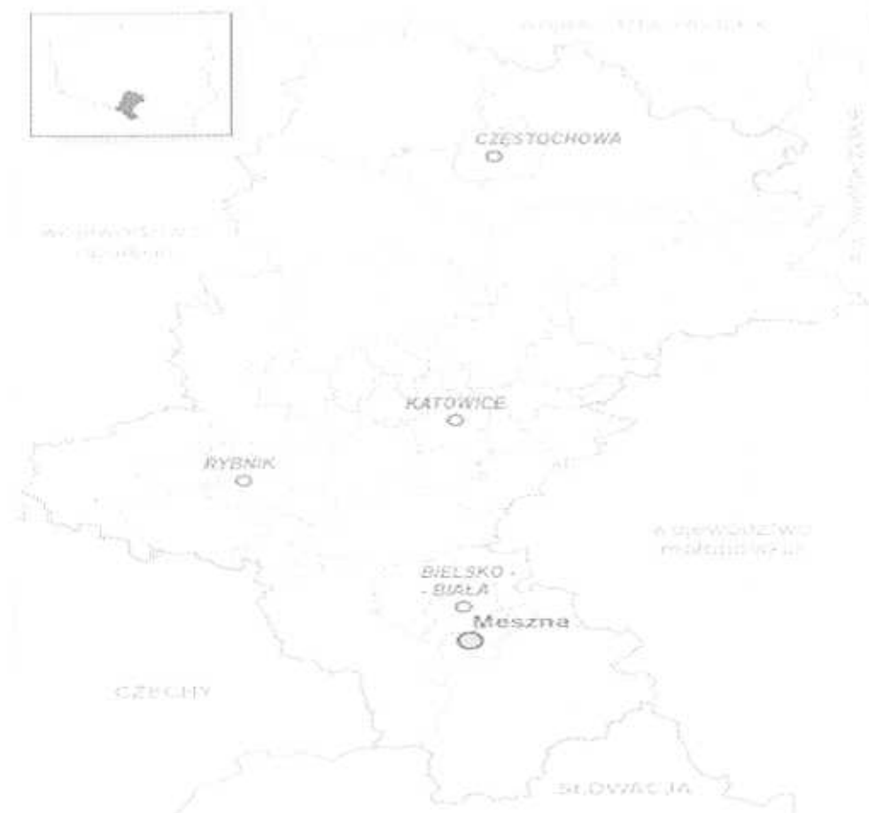
Rysunek 1: Lokalizacja sołectwa Mieszna na tle województwa śląskiego.

Odległości do najbliższych lotnisk międzynarodowych z Miesznej wynoszą: w Katowicach – Pyrzowicach 90 km, w Krakowie Balicach 120 km, w Ostrawie 65 km. Odległość do miasta wojewódzkiego Katowice z Miesznej wynosi 60 km.