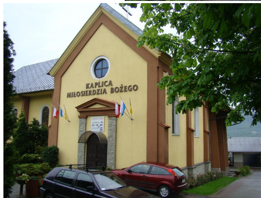
Widok kaplicy od strony pd