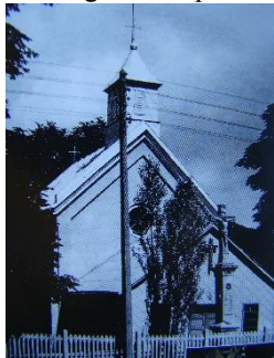
Fot. archiwalna: kaplica przed rozbudową

8. Fotografia z opisem wskazującym orientację albo mapa z zaznaczonym stanowiskiem archeologicznym