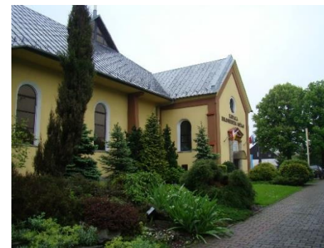
Widok kapliczki od strony pn-zach