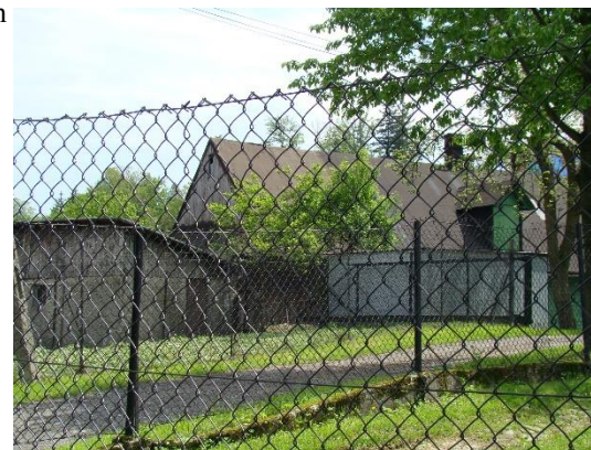
Widok chałupy od strony pn-zach

8. Fotografia z opisem wskazującym orientację albo mapa z zaznaczonym stanowiskiem archeologicznym