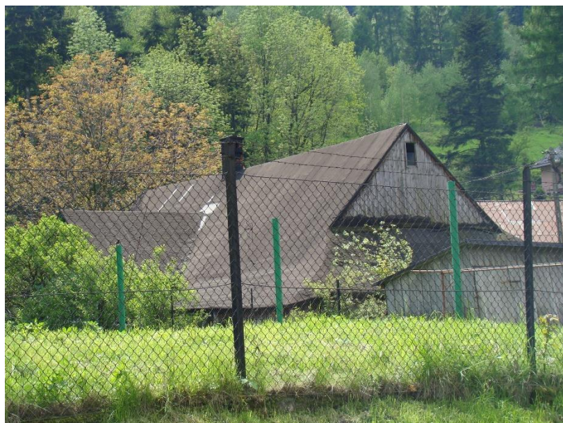
Widok chałupy od strony pn-wsch

Prac. Proj.-Konserwatorska ARKADA listopad 2017r.