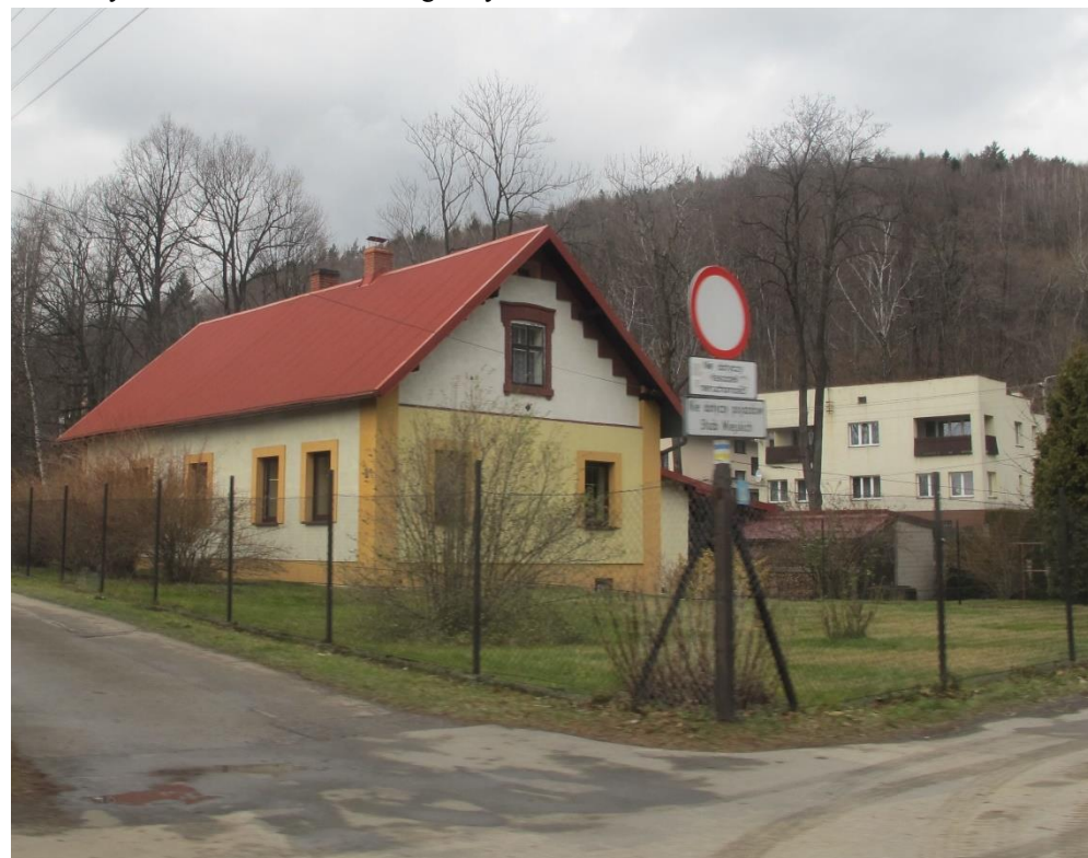
Widok domu od strony wsch 2017r.