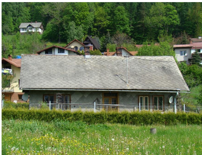
Widok domu od strony pd