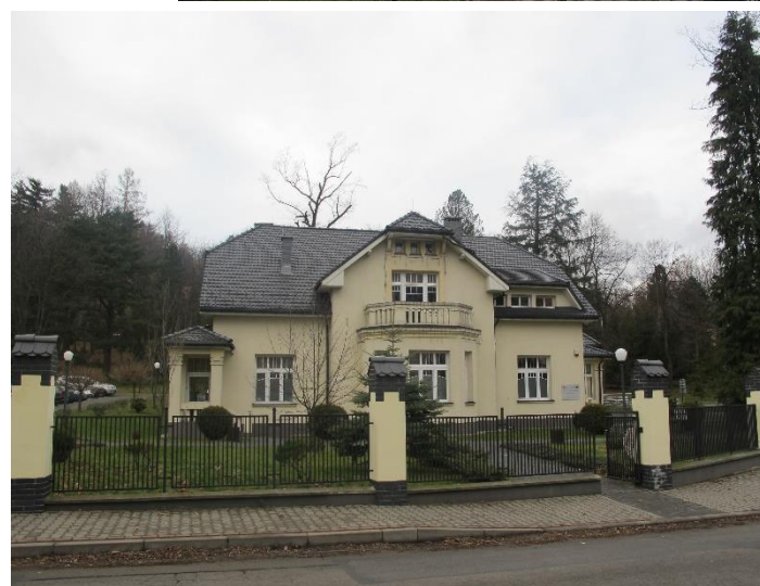
Widok frontowy budynku (od strony pd-wsch)