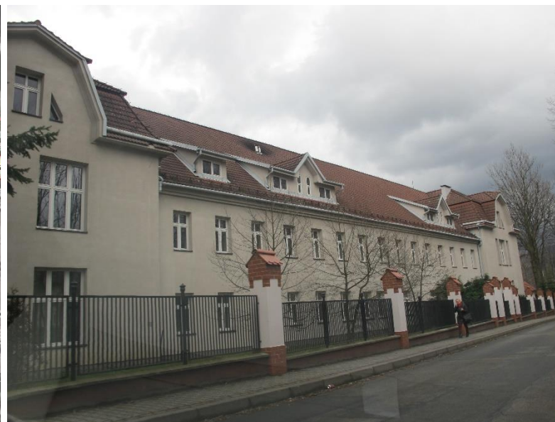
Widok budynku od strony pd