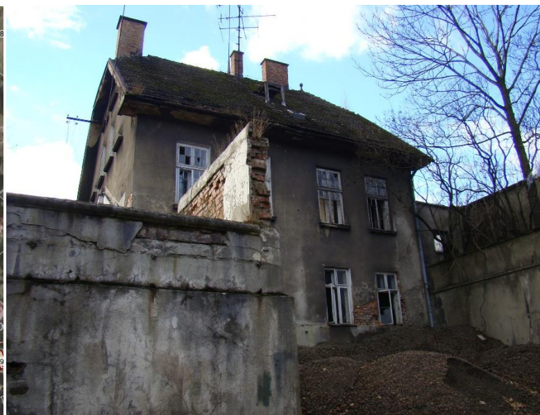
Widok obiektu od strony pd-wsch