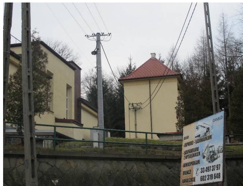
Widok obiektu od strony wsch 2017r.