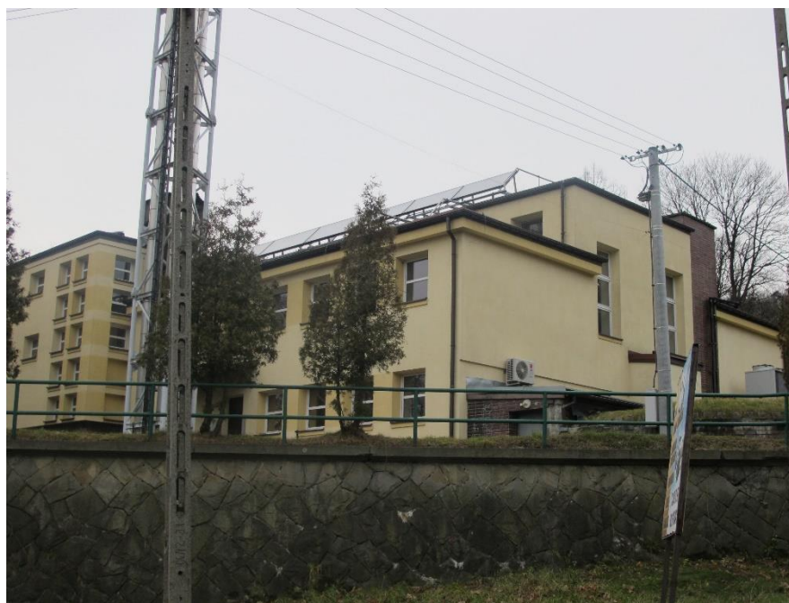
Widok obiektu od strony wsch