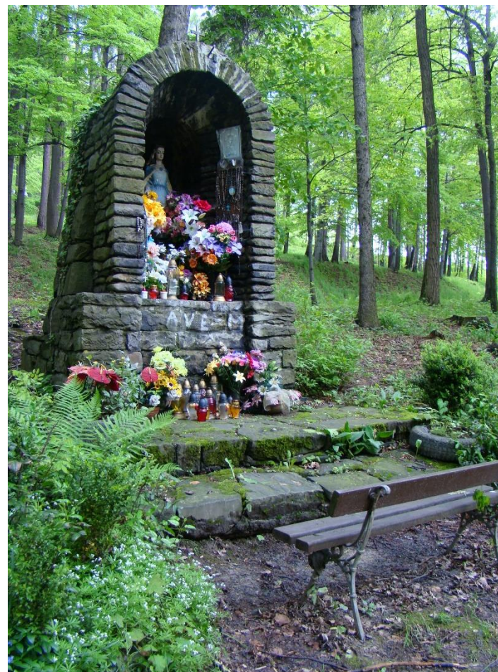
Widok kapliczki od strony pd