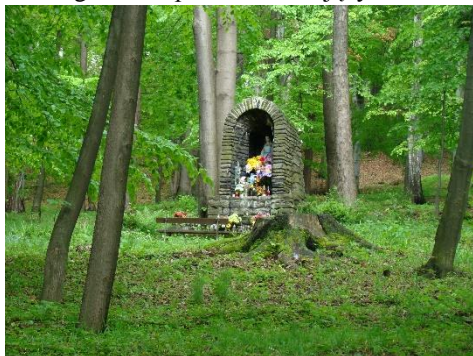
Widok kapliczki od strony wsch

8. Fotografia z opisem wskazującym orientację albo mapa z zaznaczonym stanowiskiem archeologicznym