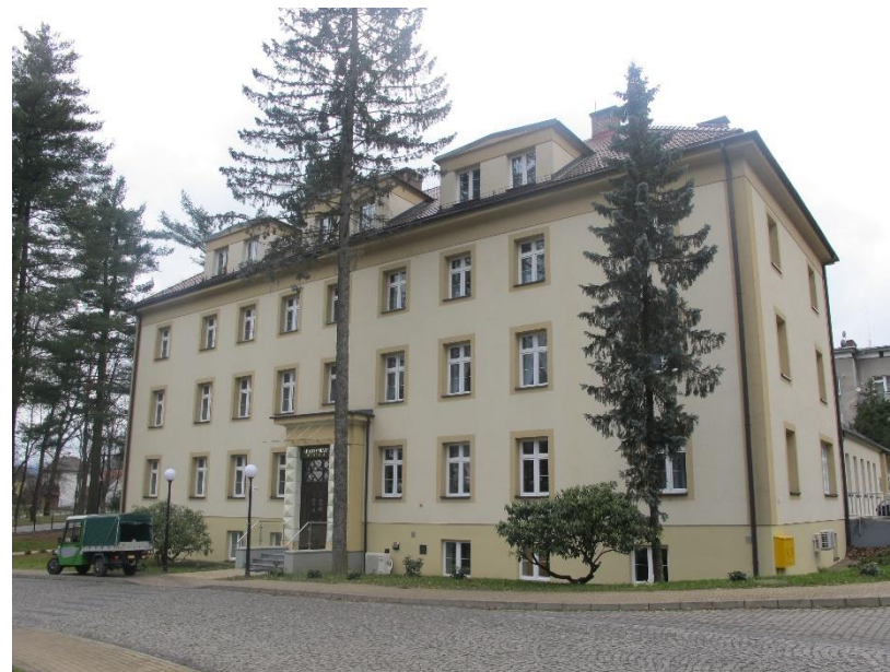
Widok budynku od strony pn