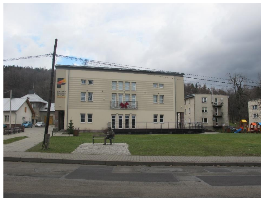
Widok budynku od strony pd