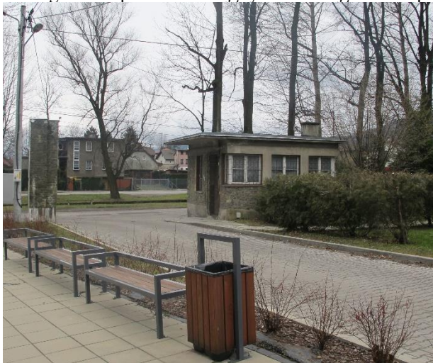
Widok portierni od strony pn 2017r.

8. Fotografia z opisem wskazującym orientację albo mapa z zaznaczonym stanowiskiem archeologicznym