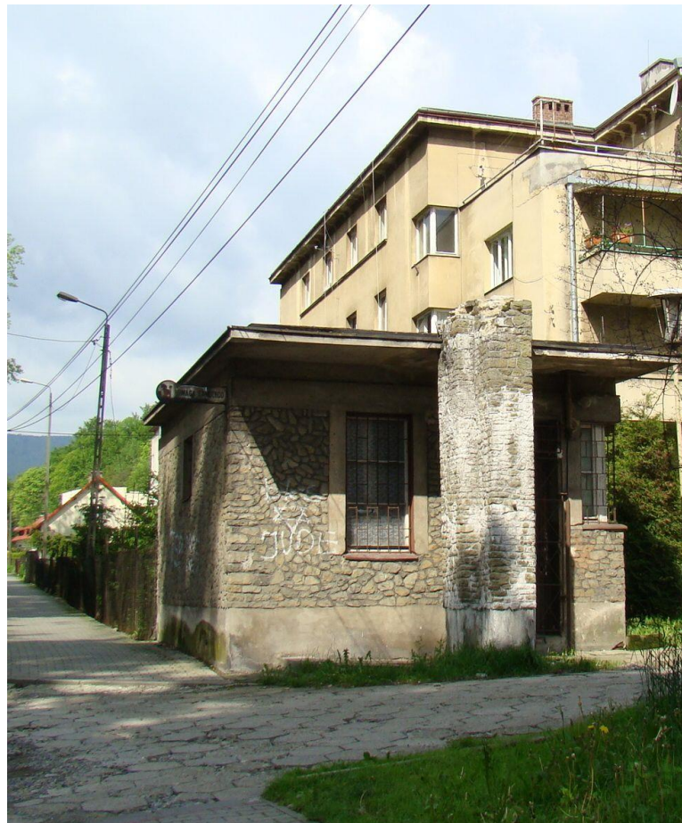
Widok portierni od strony wsch 2010r.