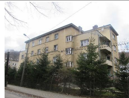
Widok bloku od strony pd-wsch

8. Fotografia z opisem wskazującym orientację albo mapa z zaznaczonym stanowiskiem archeologicznym