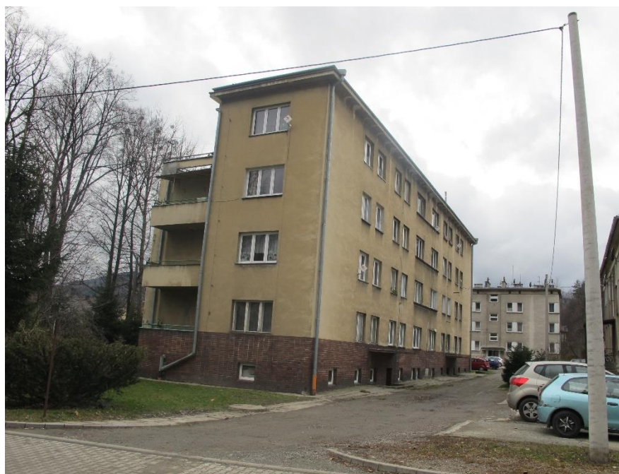
Widok bloku od strony pn-wsch