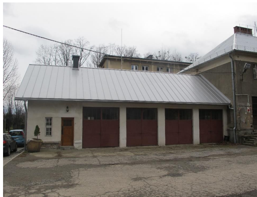
Widok budynku od strony pn (d.stolarnia, ob. prac. rzeźby)