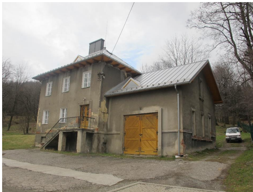
Widok budynku od strony pd-wsch 2017r.