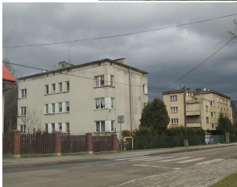
Widok budynku od strony pd-zach 2017r.