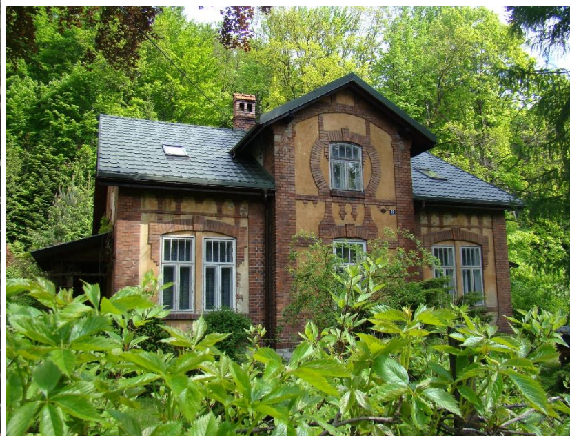
Widok budynku od strony pd