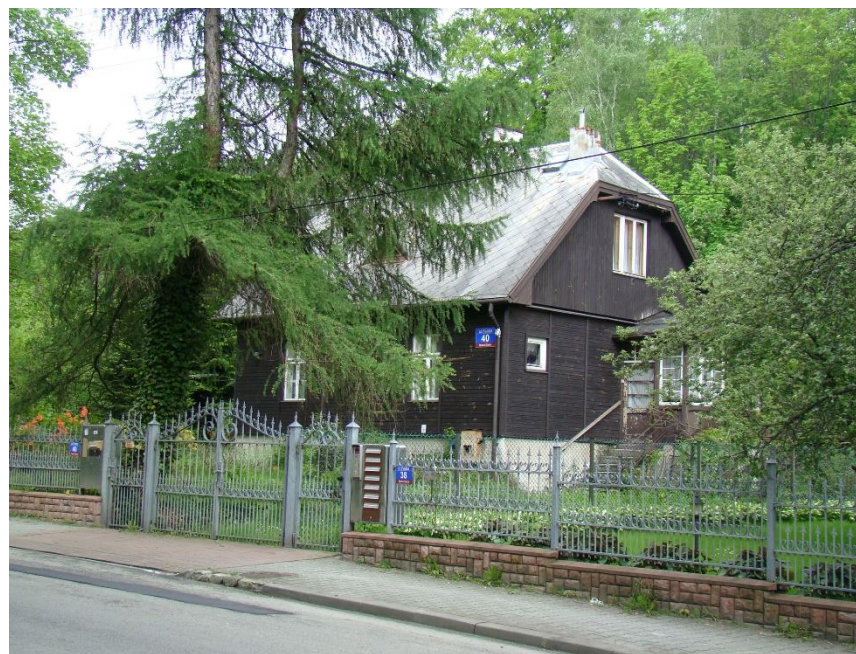
Widok budynku od strony wsch