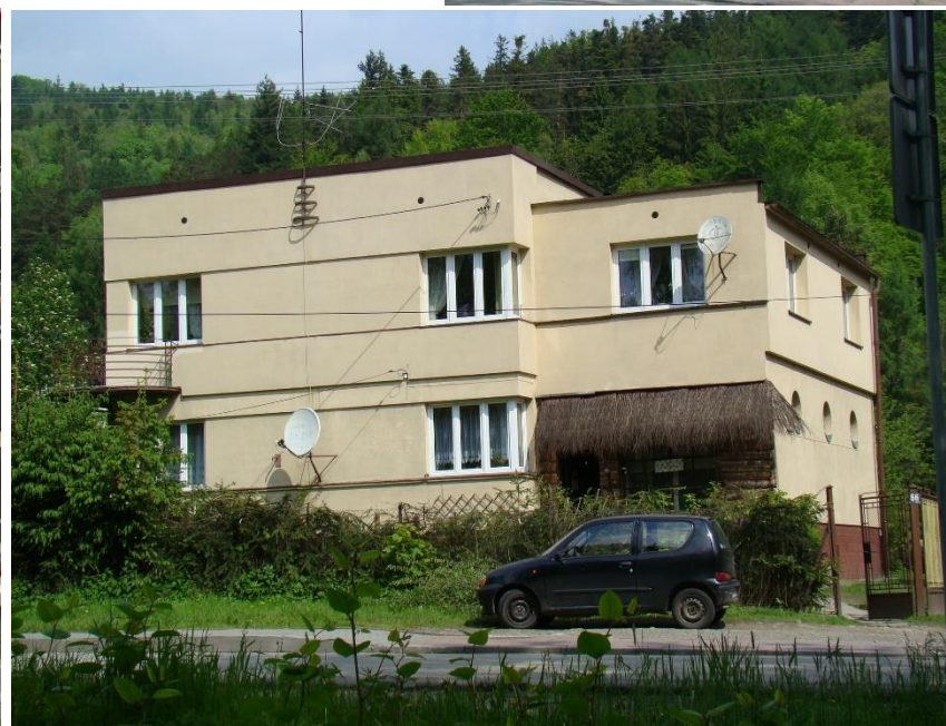
Widok budynku od strony pd