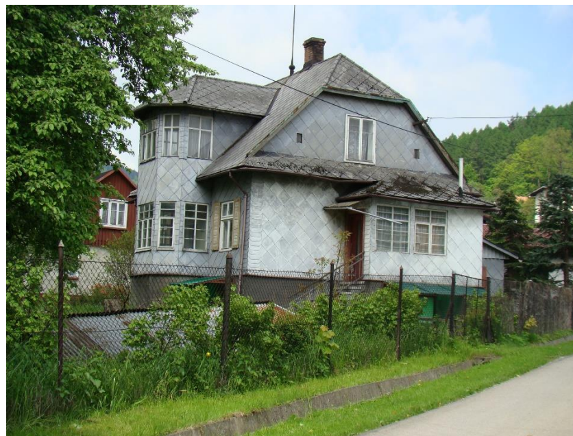
Widok budynku od strony wsch