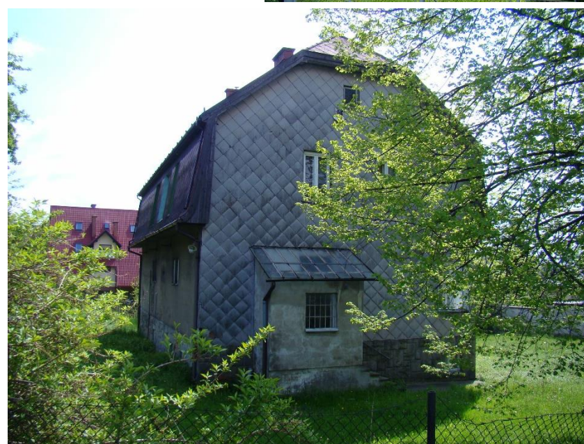
Widok budynku od strony zach