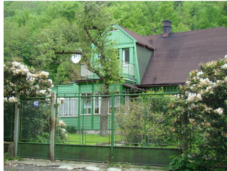
Widok budynku od strony pd-wsch