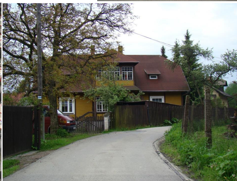
Widok budynku od strony pn