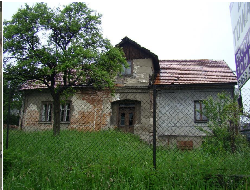
Widok budynku od strony wsch