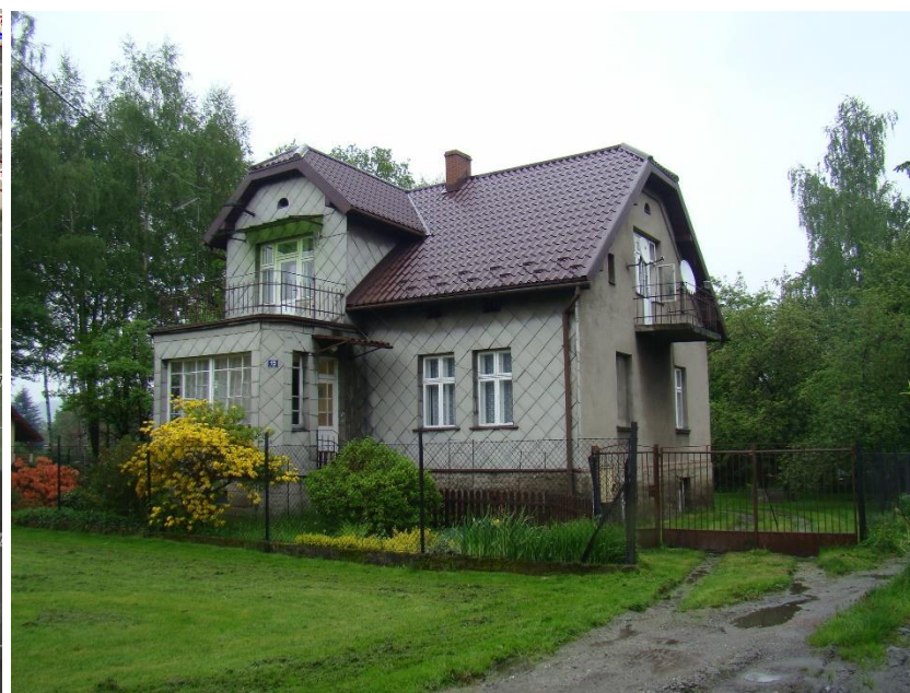
Widok domu od strony pd-zach