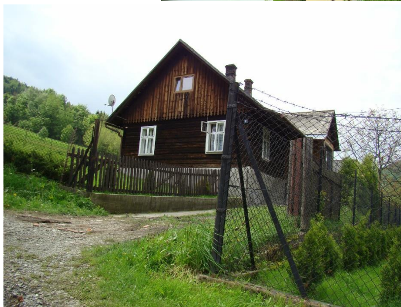
Widok domu od strony pn-wsch