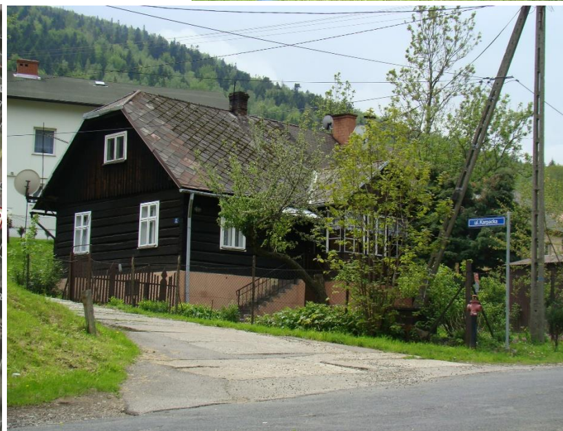
Widok domu od strony pn-wsch