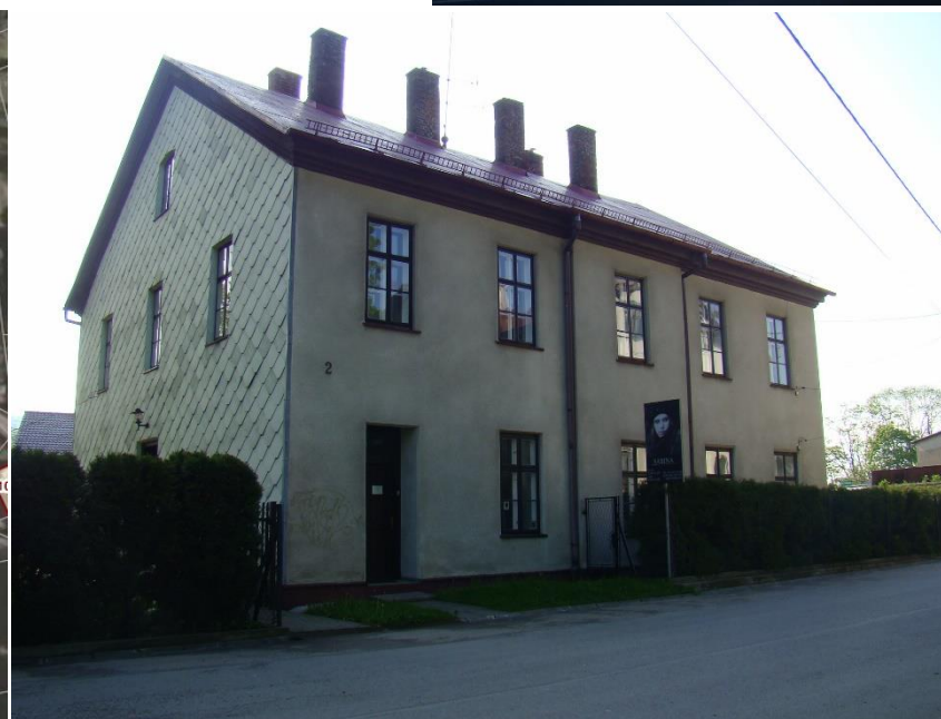
Widok domu od strony pn