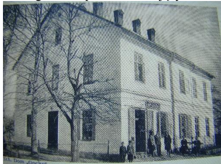
Widok domu od strony pd