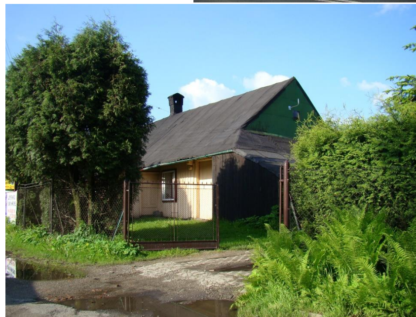
Widok chałupy od strony pn