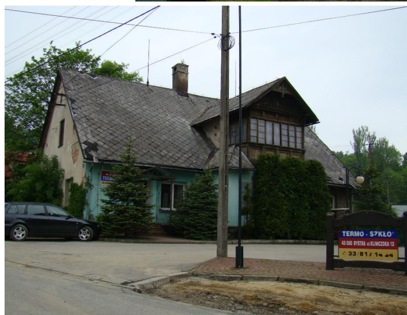
Widok domu od strony wsch