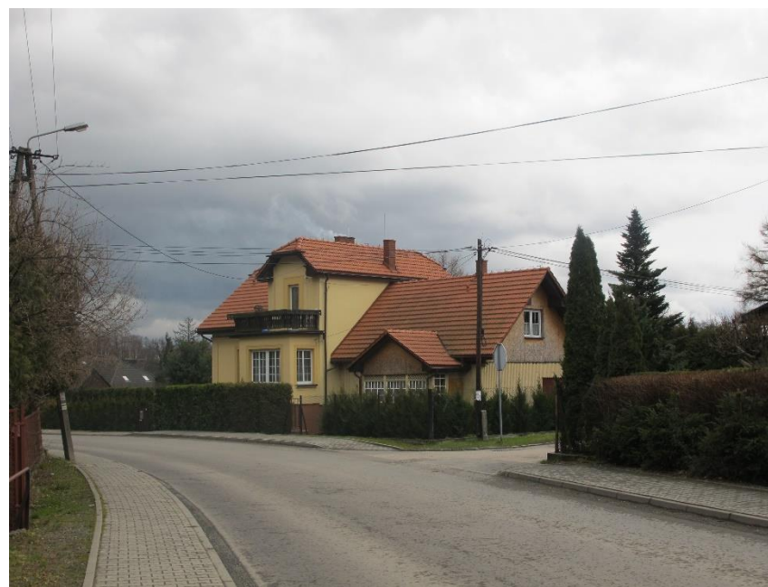
Widok domów od strony zach 2017r.