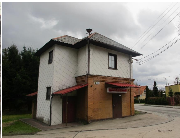
Widok remizy od strony pn-zach