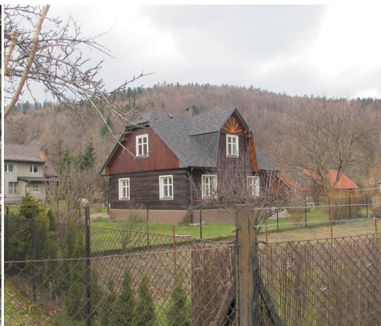
Widok domu od strony pd