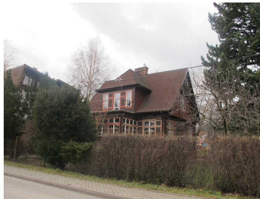
Widok domu od strony pn-wsch