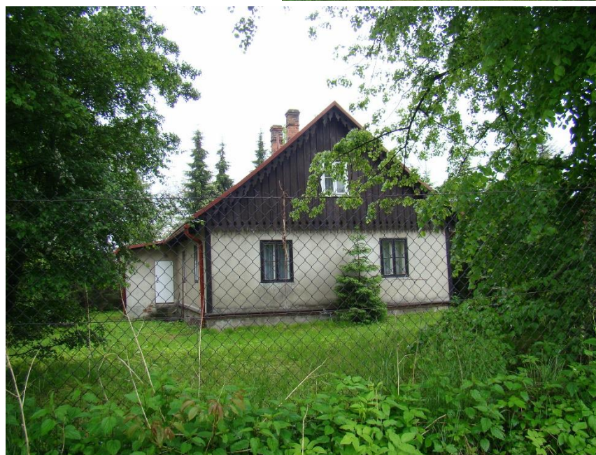
Widok domu od strony wsch