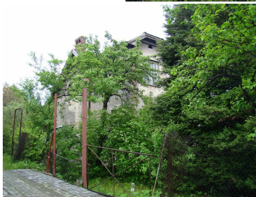
Widok domu od strony pd-zach