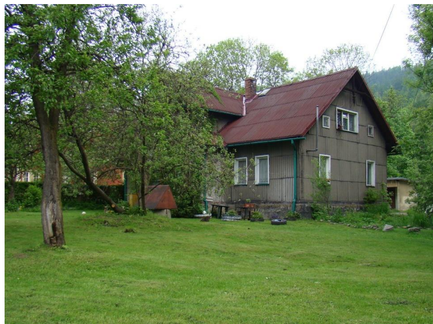
Widok domu od strony wsch.