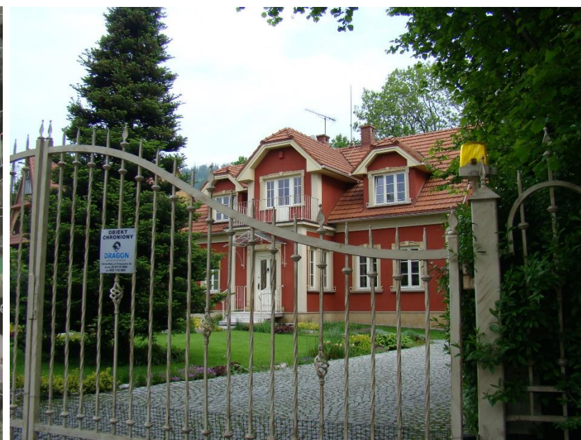
Widok domu od strony pd