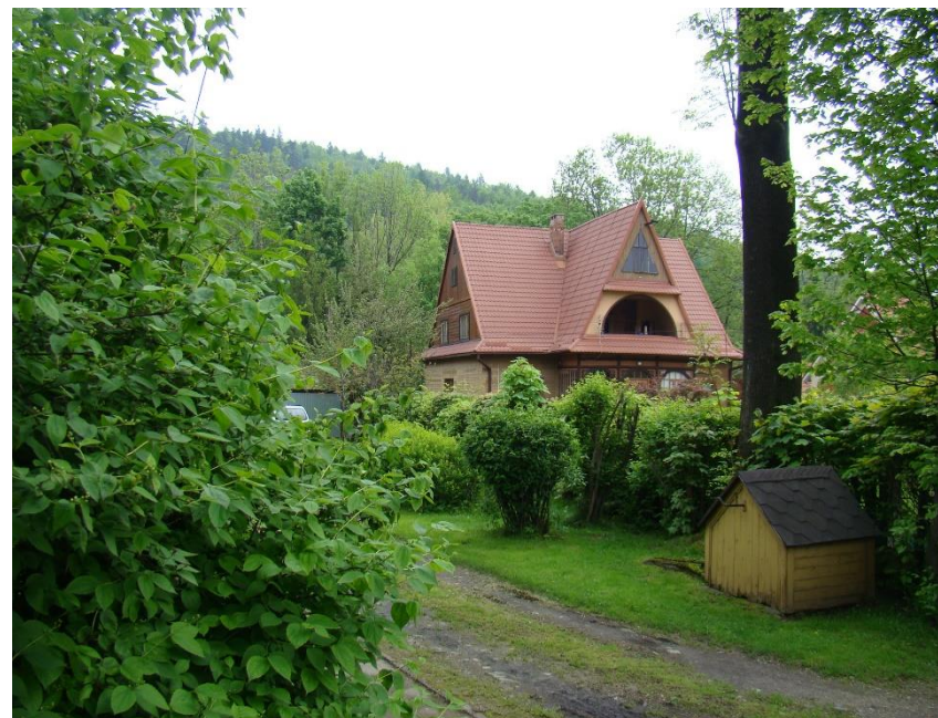
Widok domu od strony pd-zach