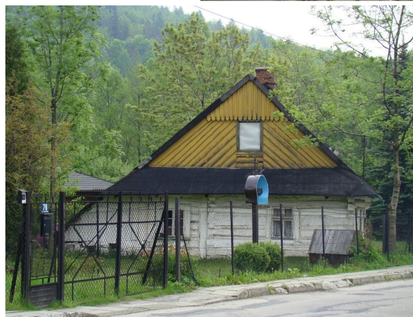
Widok chałupy od strony zach