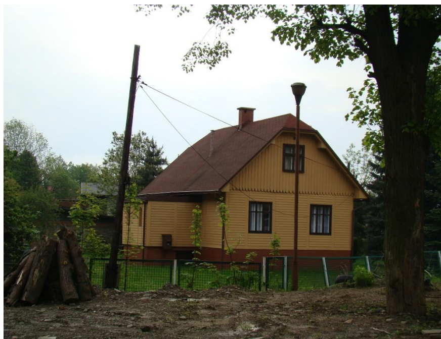
Widok domu od strony pn-zach