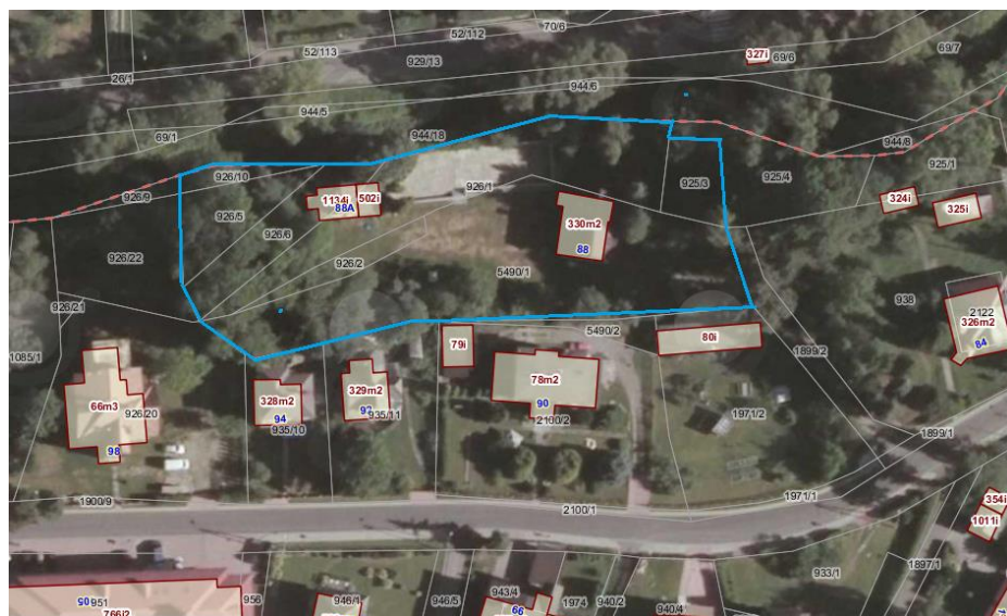
Ortofotomapa z zazn. lokalizacją posesji 1:750

Prac. Proj.-Konserwatorska ARKADA listopad 2017r.