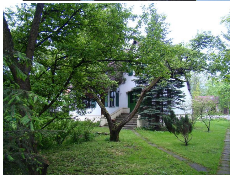
Widok posesji od strony wsch