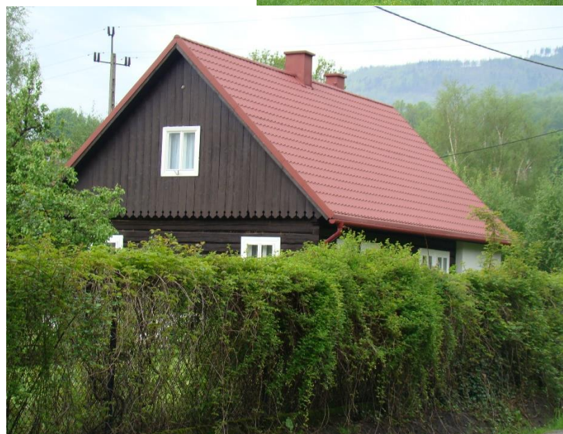
Widok domu od strony pn-wsch