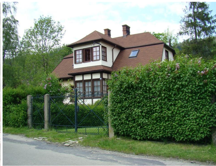
Widok obiektu od strony pd-wsch