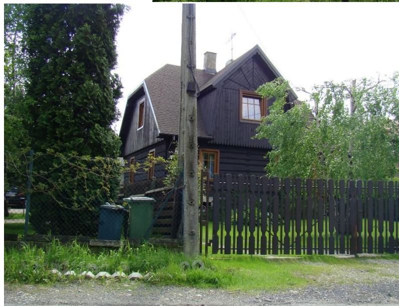
Widok domu od strony pn