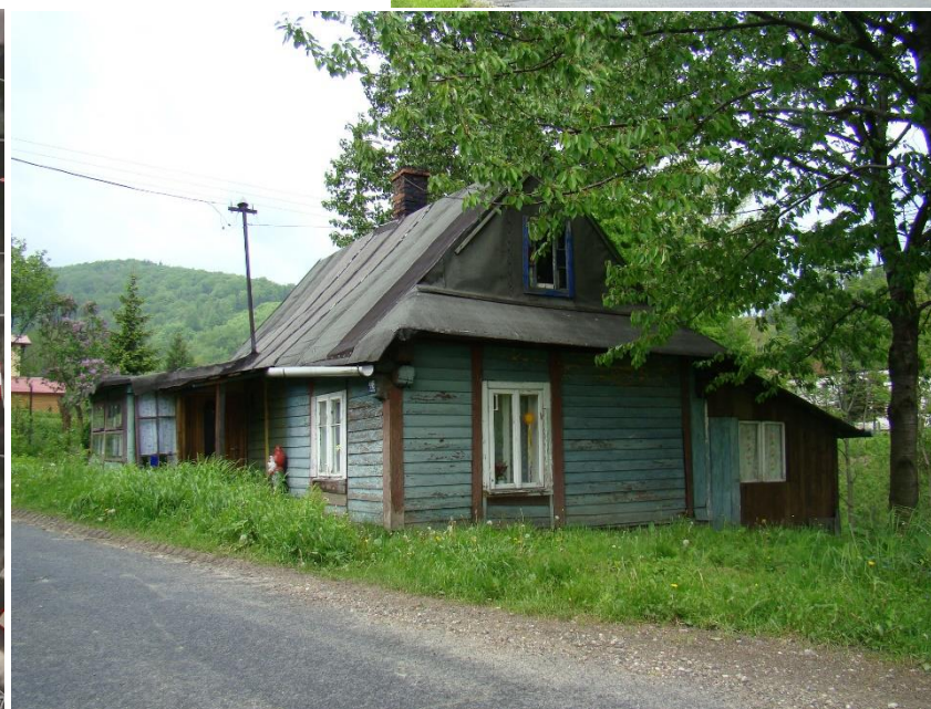
Widok budynku od strony pd-wsch