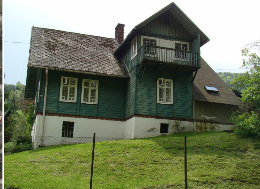
Widok budynku od strony pn