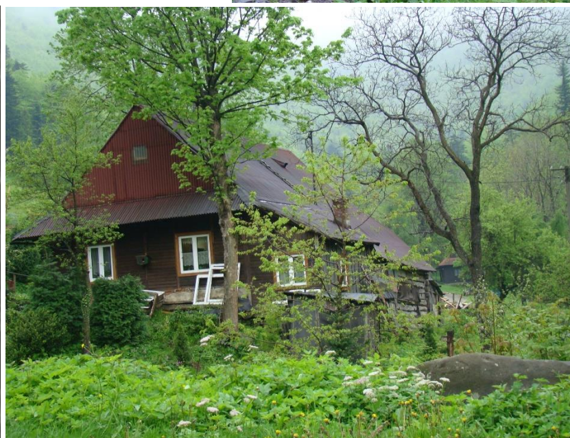
Widok chałupy od strony pn-wsch